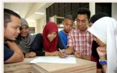
PutraBLAST (In Campus)

Putra Blended Learning Assistive System & Technology