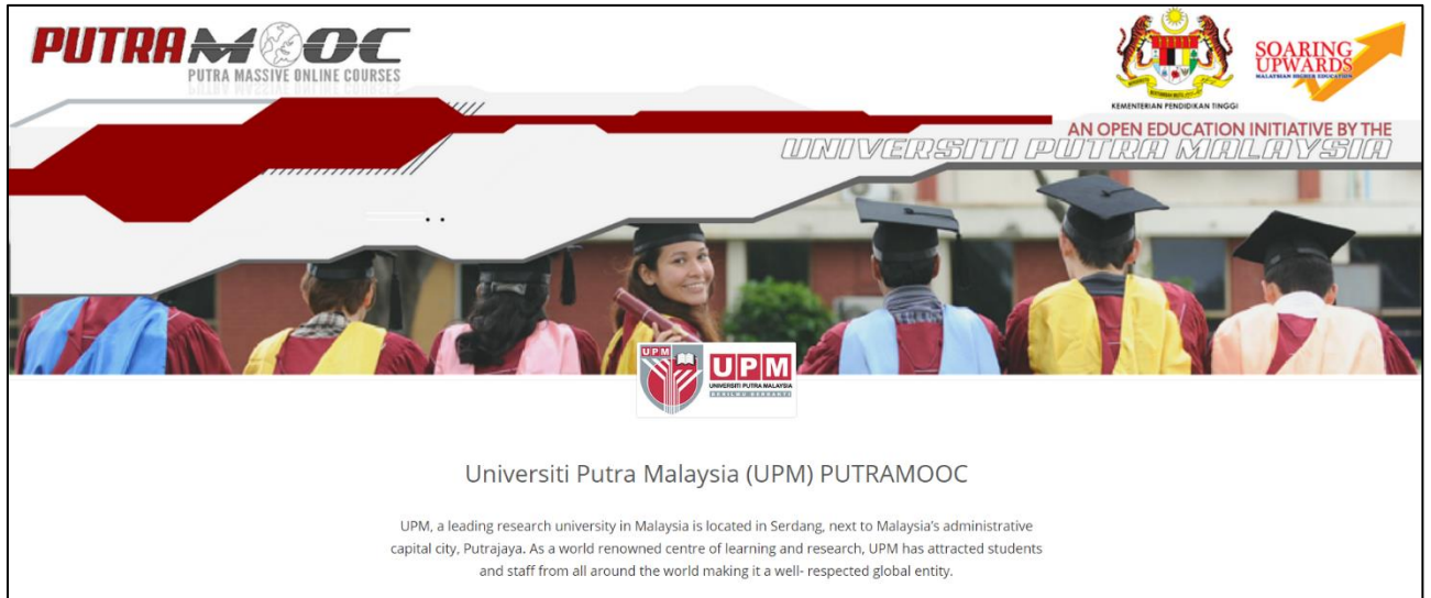
Rajah 2: Paparan platform OpenLearning